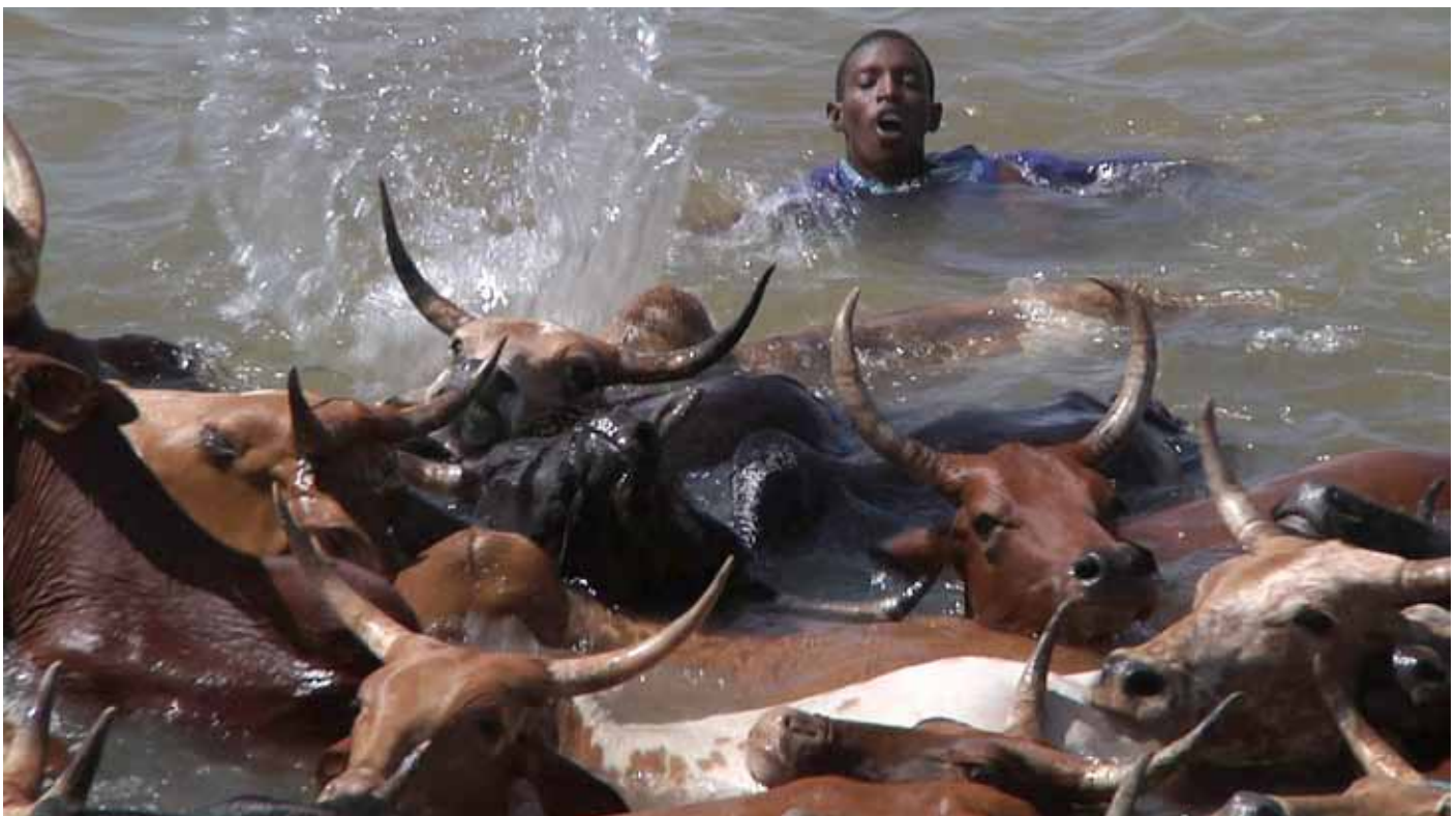
Un jeune berger accompagne son troupeau dans la traversée du fleuve Niger.