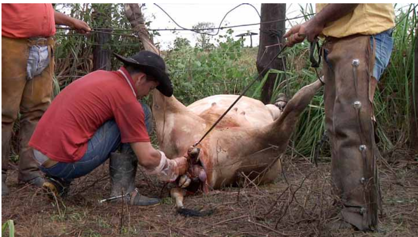
Un vélage difficile en Amazonie.