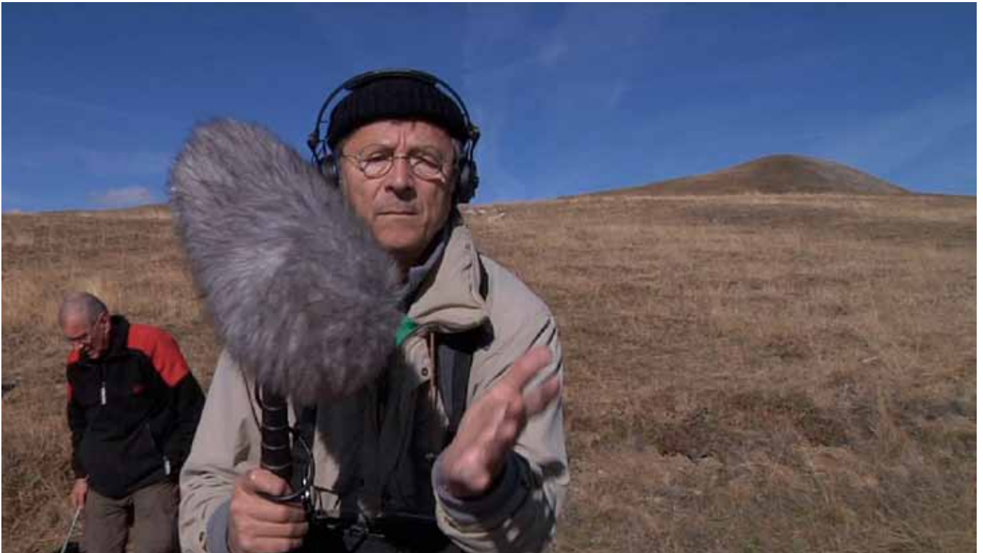
Sur le tournage du film.

Avec plus d'une trentaine de documentaires pour la télévision à son actif, « De chair et de lait » est son deuxième long-métrage documentaire.