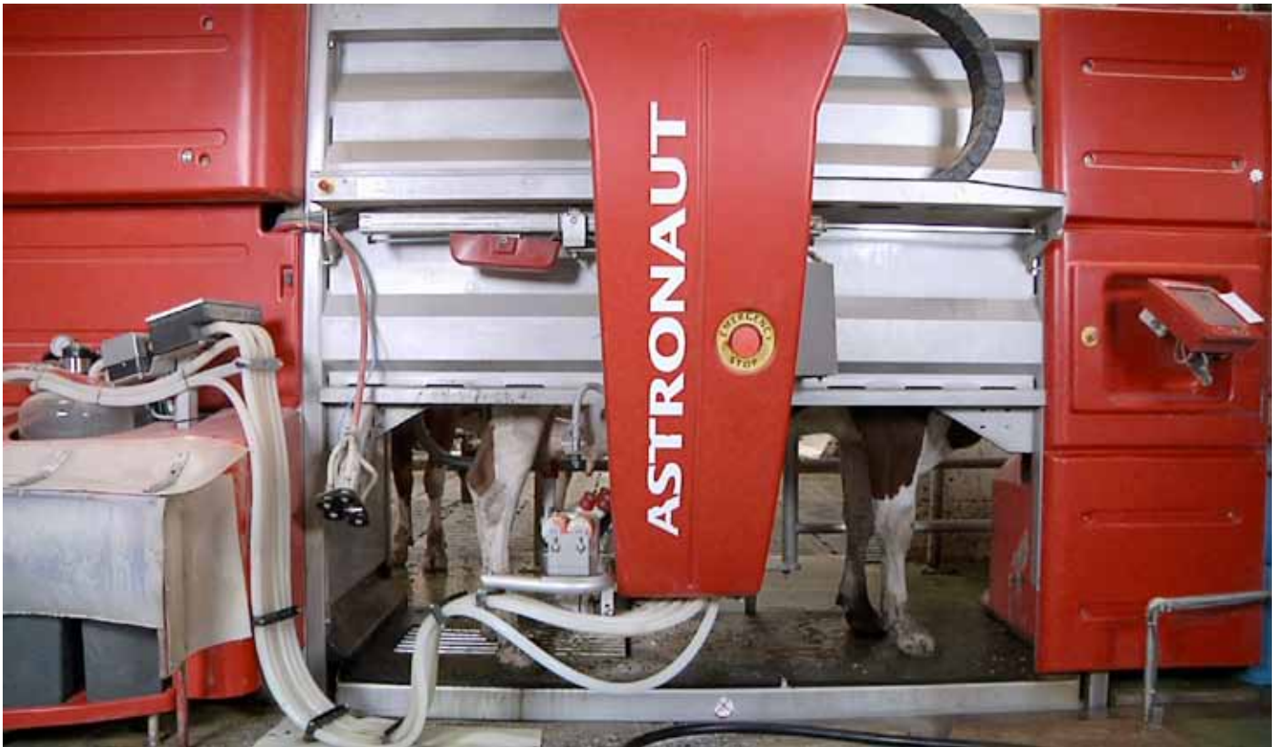
Robot de traite en Suisse.