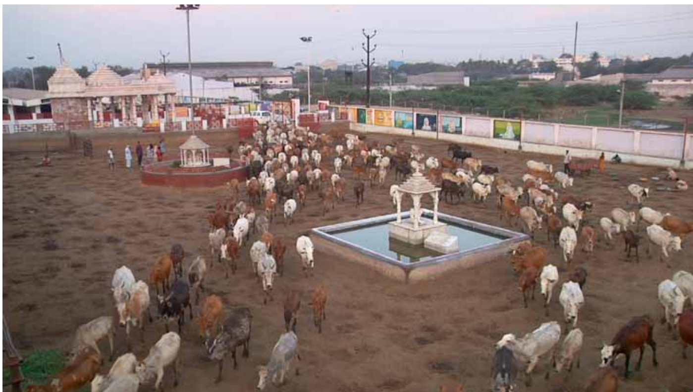
En Inde, dans un hospice pour vaches âgées et malades.