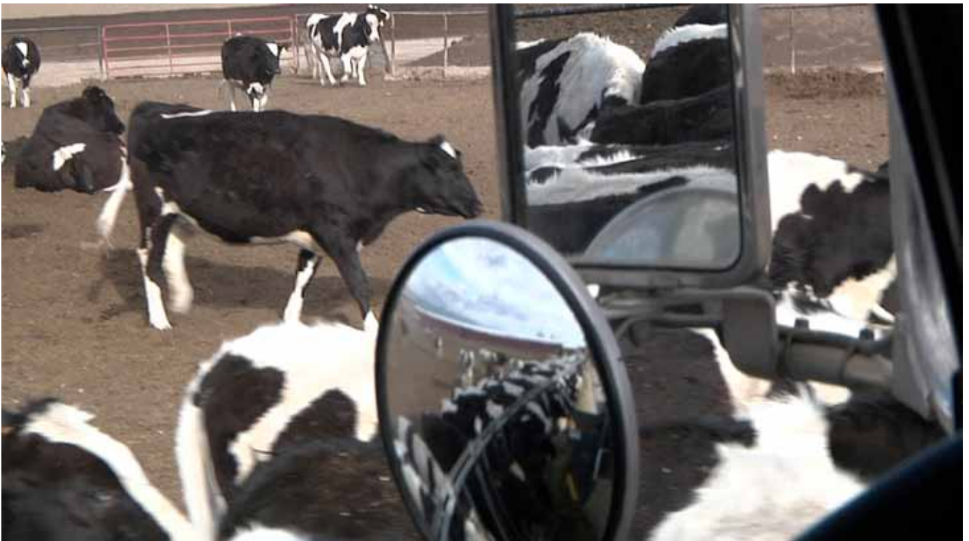
Exploitation laitière intensive au Colorado.